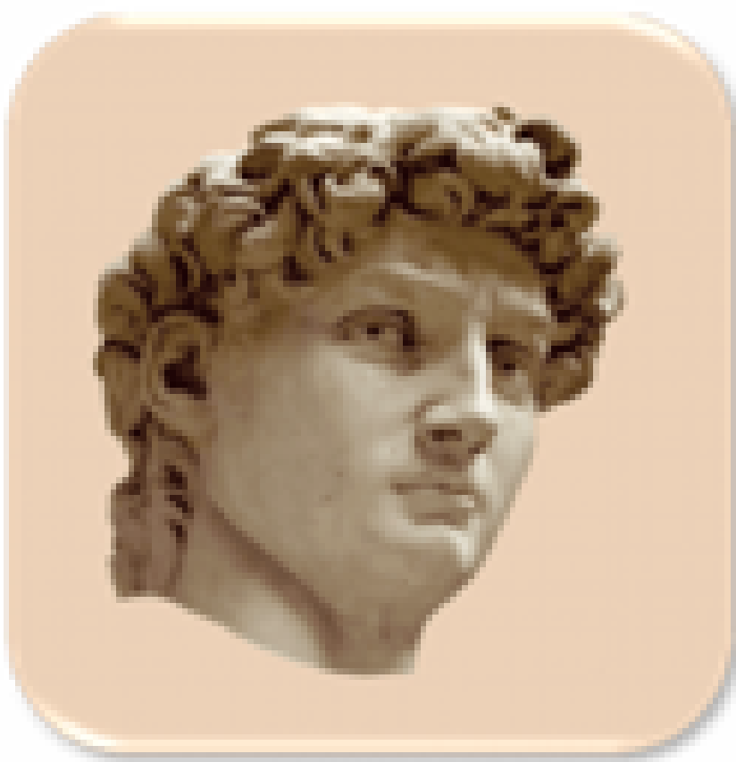
David (Leonardo Da Vinci)